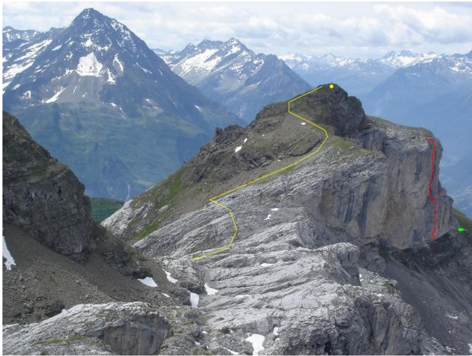
Rinderstock Nord-Ostwand vom „Stich“ (Gelb: Normalroute / Rot: Erstbegehung Nord- Ostwand / Grün: Rastplatz, grasige Schulter)

Sicherungshaken Marke Eigenbau geschlagen. Er sollte, wegen der mennigroten Farbe, künftigen Seilschaften als Orientierungshaken dienen, meinten wir lachend.