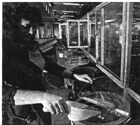
In Baar (Bild) wird geschlossen, in Willisau hingegen werden zusätzliche Arbeitskräfte dringend benötigt.

Für das Unternehmen kommt dies offensichtlich unerwartet. Denn neun Monate nach der niederschmetternden Ankündigung, die zwei Produktionsstätten in Baar aufzuheben, müssen in der modernen Fabrik von Willisau Sonderschichten geleistet werden. Angesagt ist Wochenendarbeit.