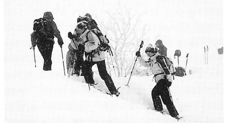
Ziel: Laucherenstöckli (1753 m), Ibergereg