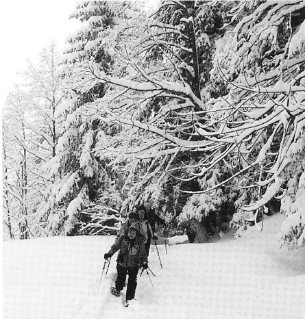
Schneeschuhtour «Fürstein» zur Ausweichtour umorganisiert. Grund: Erhebliche Lawinengefahr und schlechte Wetterprognosen.